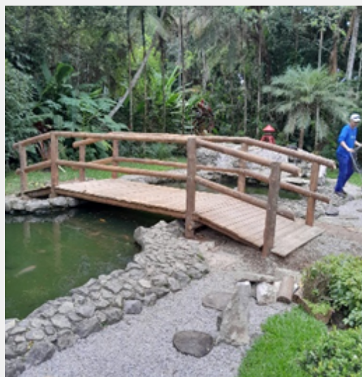
Construção da ponte - Jardim Japonês