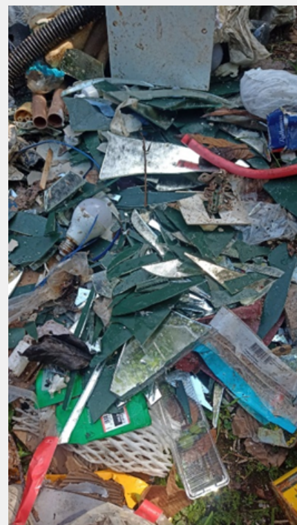
Material descartado na bag da Yc