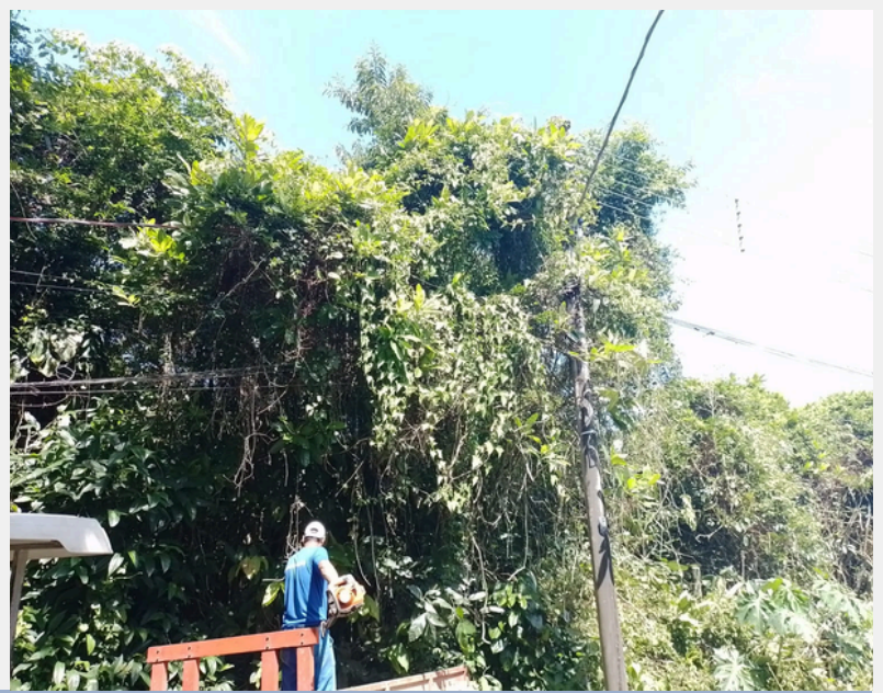
Serviços de Poda