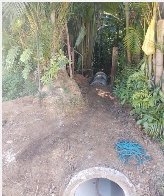
Instalação de manilha para escoamento de água pluvial - Quadra Xv