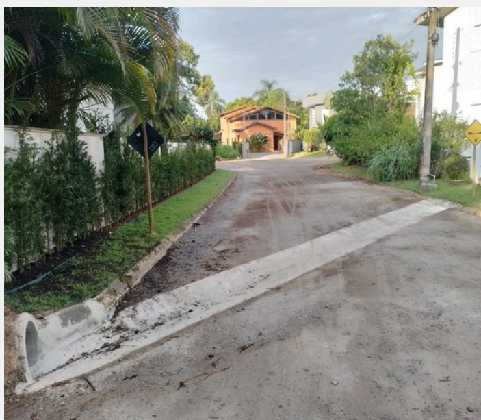
Construção de depressão - Quadra Xv