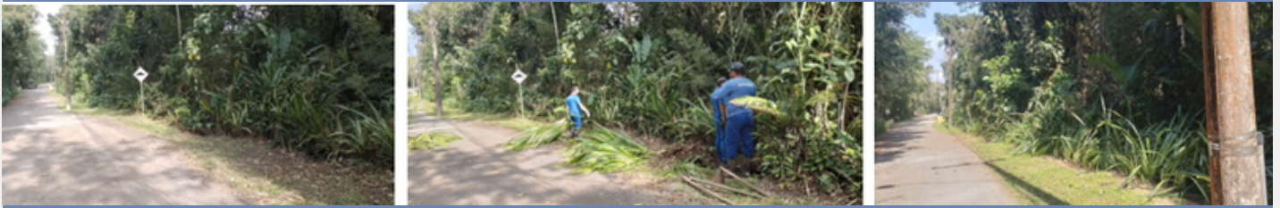
Manutenção - plantio de cerca viva (segurança) - Marginal Y