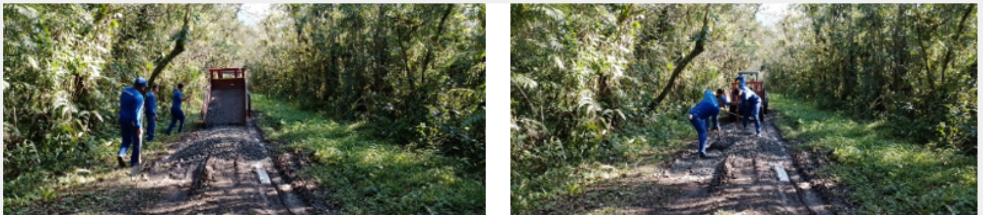
Manutenção de passagem de serviço