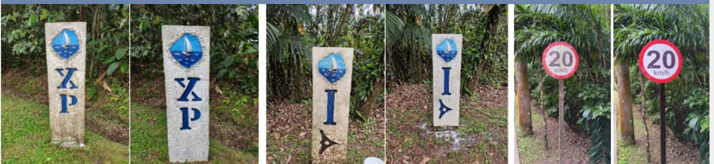
Manutenção e limpeza de placas