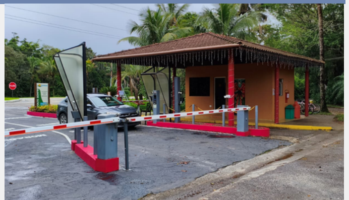
Pintura das Portarias