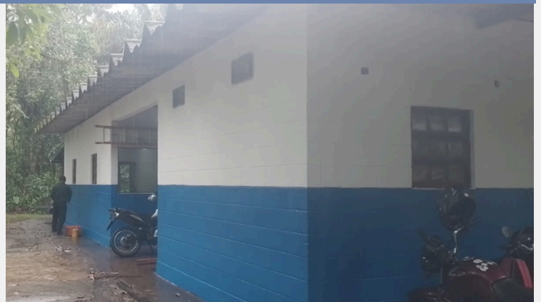
Pintura na Manutenção