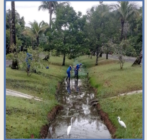
Limpeza do canal da praia