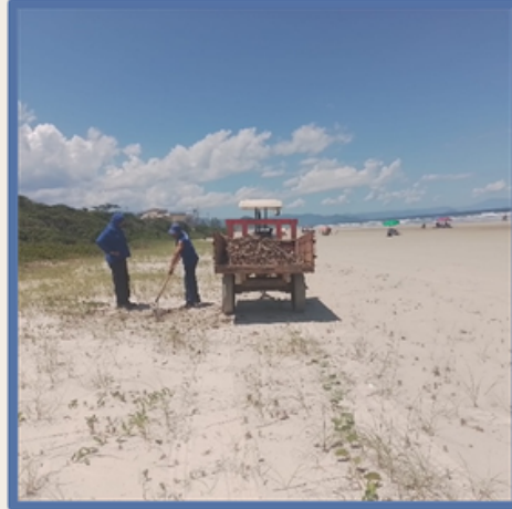
Limpeza de praia