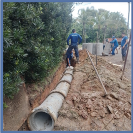
Instalação de manilhas

Além disso, foi adquirido um novo trator para otimizar os serviços de coleta de lixo reciclável e orgânico, transporte de materiais e recolhimento de podas, reduzindo o tempo das atividades de manutenção.